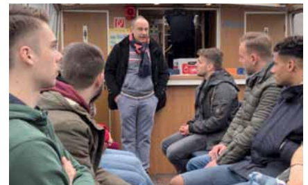
Interesierte Zuhörer aus BW.