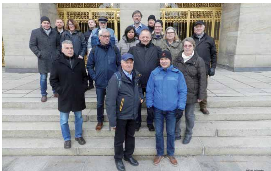
Auf den Stufen der Geschichte