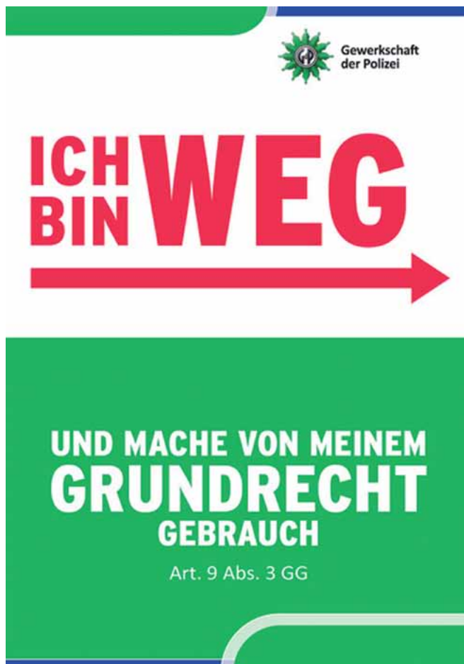
Unsere Postkartenaktion für die Abwesenheit bei Streikmaßnahmen